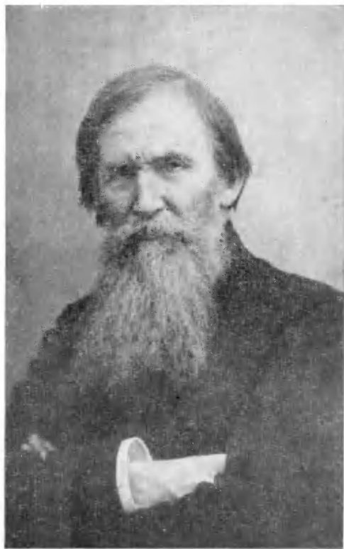
В. М. ВАСНЕЦОВ 1848 — 1926 гг.