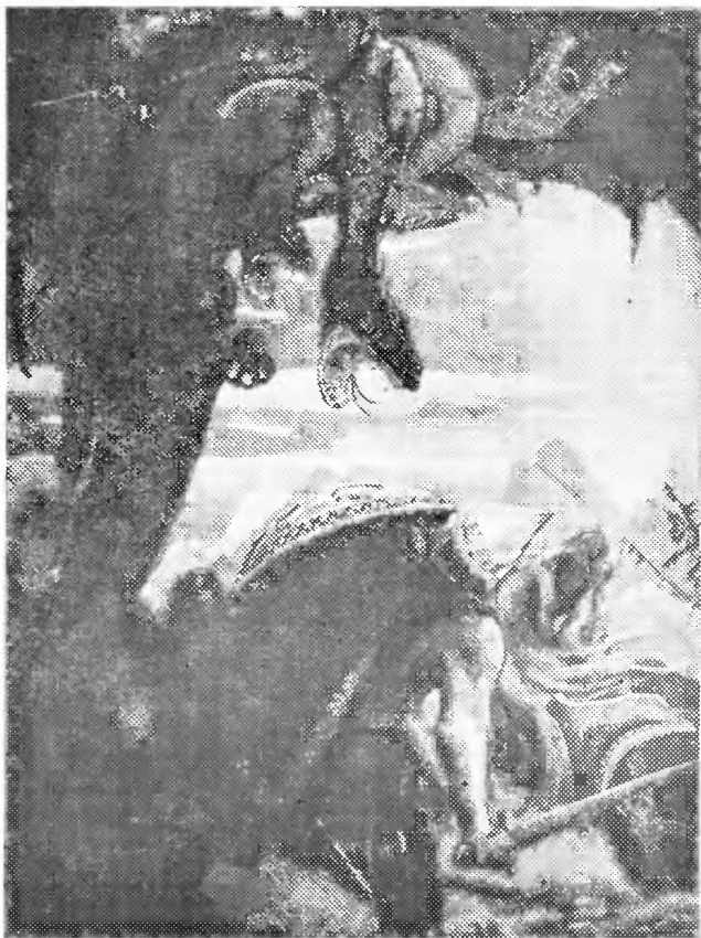
«Бой Добрыни Никитича со Змеем-Горынычем». 1913—1918 г.

«Пошел бой жестокий. Горы Сорочинские посыпались, Дубы с корнями вывернулись, Трава на аршин в землю ушла.