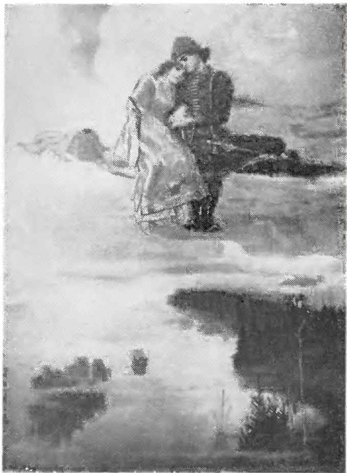
«Ковер-Самолет». 1919—1926 гг.

«...Сели на ковер Иван-царевич с Василисой Прекрасной и понеслись, как птица... и на ковре влетели в свое царство».