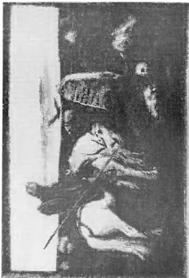
«Витязь на распутье». 1882 г. «...И раздумался старый Илья Муромец, Илья Муромец, сын Иванович: Да в которую дорожку будет ехать?..»