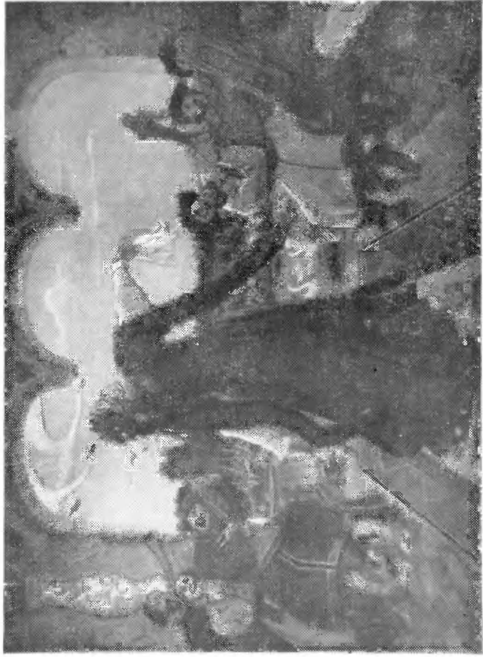
«Царевна-лягушка», 1901—1918 гг.

«...А как пошла Василиса Премудрая танцевать, махнула левой рукой — сделалось озеро, махнула правой — и поплыли по воде белые лебеди...»